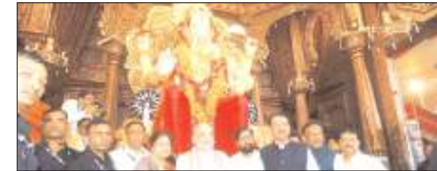
शाह हर साल लालबाग के राजा के दर्शन के लिए मुंबई आते हैं। वह इस साल भी लालबाग के राजा के दर्शन करने आए थे। लालबाग के राजा को सौगंध पिता के नाम से जाना जाता है। इसलिए यहां लाखों श्रद्धालु दर्शन के लिए आते हैं। साथ ही

टीम एक्शन इंडिया/कानपुर केंद्रीय गृह मंत्री अमित शाह ने बप्पा के दर्शनकिये। शाह महाराष्ट्र के मुख्यमंत्री एकनाथ शिंदे और महाराष्ट्र के उपमुख्यमंत्री देवेन्द्र फडणवीस के साथ 'लालबाग के राजा गणपति मंडल' पहुंचे। जहां पर सभी नेताओं के साथ शाह ने गणेश भगवान का दर्शन किये, बता दें की अमित शाह हर साल 'लालबाग के राजा का दर्शन करने आते हैं। इस साल भी गृह मंत्री अमित शाह ने अपने परिवार के साथ लालबाग के राजा के दर्शन किए, गृहमंत्रों