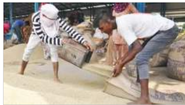
बाजरे की सरकारी खरीद के लिए बढ़ रहा किसानों का इंतजार नारनौल में बाजरे का सरकारी समर्थन मूल्य पर खरीद को लेकर किसानों को इंतजार बढ़ता जा रहा है, लेकिन सरकार की ओर से अभी

टीम एक्शन इंडिया/संजय शर्मा नारनौल। हरियाणा सरकार ने 25 सितंबर से धान व बाजरे की खरीद शुरू करने का फैसला लिया है। पिछले सालों तक खरीफ फसलों की खरीद एक अक्तूबर से होती रही है, लेकिन इस बार एक सप्ताह पहले ही किसान अपनी फसल बेच सकेंगे। किसान संगठनों की मांग थी कि इस बार धान की खरीद 20 सितंबर से शुरू की जाए। केंद्र सरकार द्वारा हरियाणा में ढाई लाख टन बाजरे की खरीद की मंजूरी के बाद सीमा से सटे पंजाब, राजस्थान और उत्तर प्रदेश से बाजरे की तस्करी की आशंका है। मुख्यमंत्री ने सभी जिलों के उपायुक्तों को निर्देश दिए हैं कि बाजरे की तस्करी